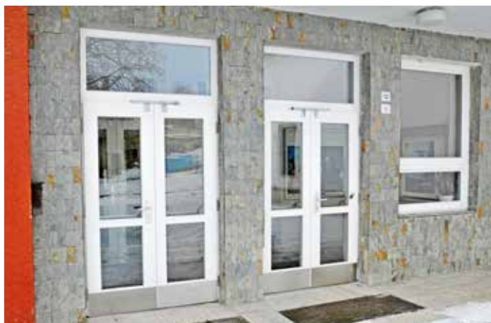
Vstupte novými dveřmi