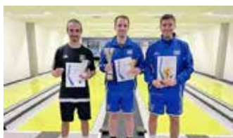
Z přeboru jednotlivců v Odrách