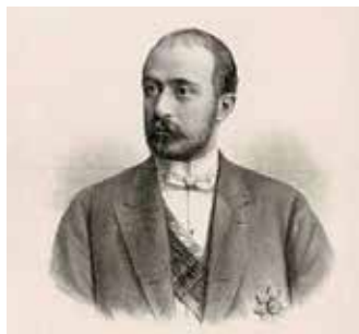
Markýz Olivier Philipp Marin Maria

Mezi nejvýznamnější návštěvy, které před první světovou válkou navštívily město Bílovec, patří bezesporu také markýz Olivier Philipp Marin Maria de Bacquehem, zemský prezident pro Rakouské Slezsko, ministr vnitra, ministr obchodu a prezident nejvyššího správního soudu. Dobový tisk se o této návštěvě v Bílovci zmiňuje v několika článcích: