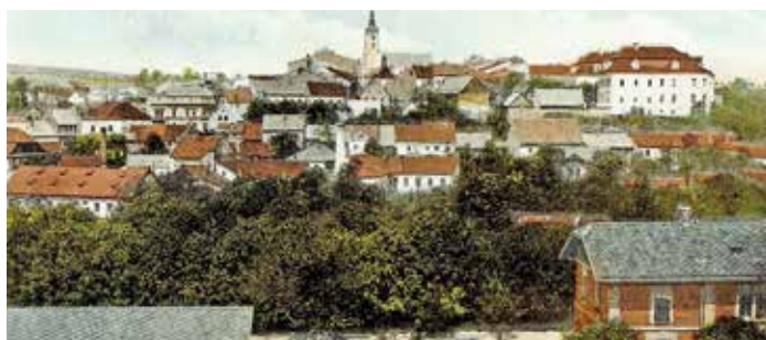
Bílovec, zámek, nádraží

Koupím byt jakékoliv velikosti jako investici, nejlépe v Bílovci, popřípadě v okolí.