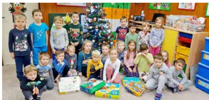
Vánoční nadílka pod stromečkem