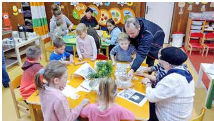
Adventní tvoření v rámci projektu Mámo, táto, pojďte si se mnou hrát