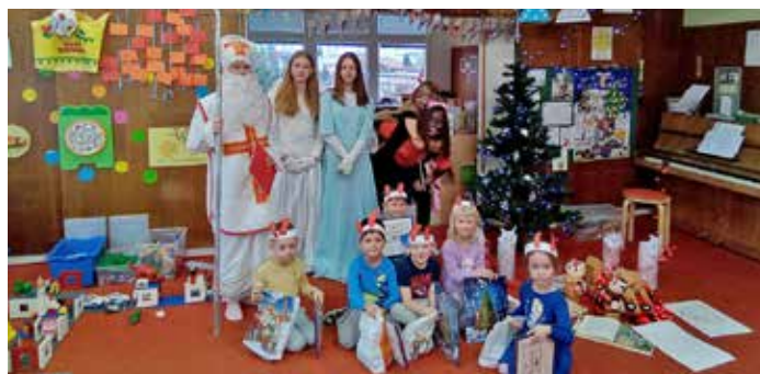
Mikulášská nadílka v režii žákyň 9. B ZŠ TGM